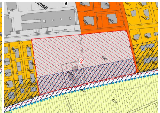
Abbildung 4: Ausschnitt BZP/KLP mit markierter Rückweisung im Bereich Sommerhalde / Langmatt (2)

Anhang 1: Zielvorgaben für Gestaltungsplangebiete gemäss § 9 Abs. 2 BNO