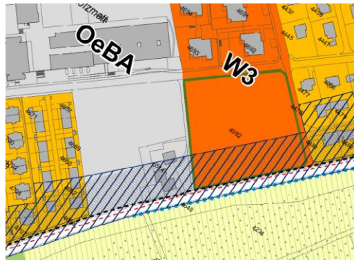
Abbildung 3: Ausschnitt gemäss Teiländerung BZP/KLP im Bereich Sommerhalde / Langmatt

Die Änderungen am Bauzonen- und Kulturlandplan/Anhang 1 BNO gestalten sich wie folgt: